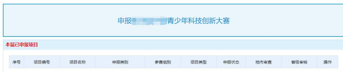
图 3 点击申报按钮