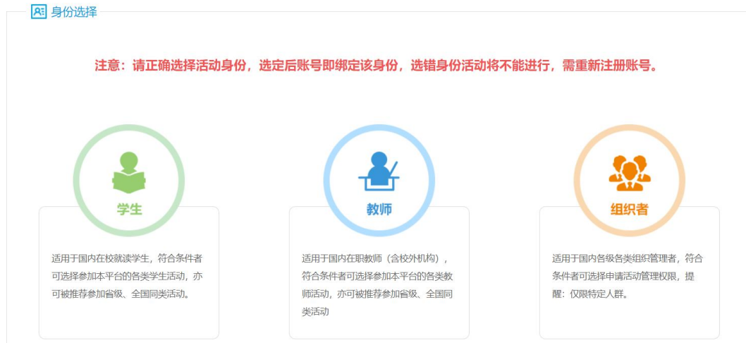
图 1 身份选择

第一步，“身份选择”下选择“学生”或“教师”；已进行过身份选择的用户无需再次选择，直接进入第二步。