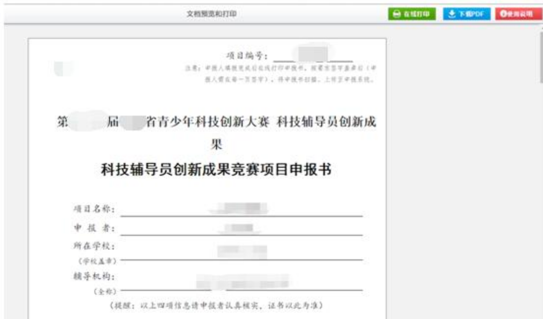
图 5-2 打印页面

第二步，通过“在线打印”与“下载 pdf”打印申报书，同时提醒各位申报者，只有在确认申报信息后才能在线打印和下载 pdf。