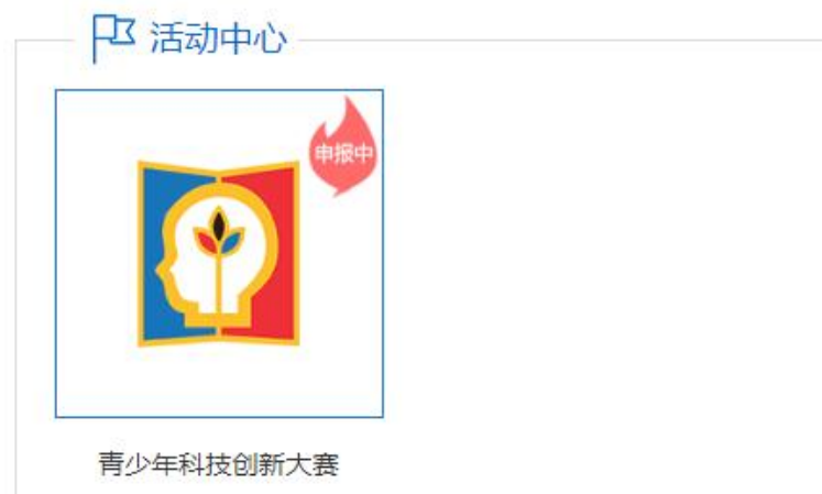
图 2 选择活动类型