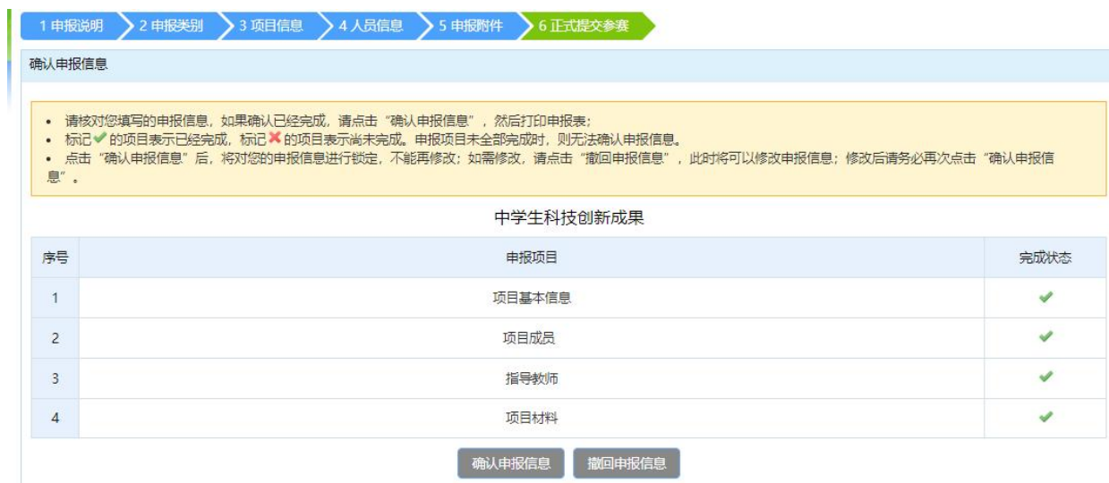
图 4-1 确认申报信息

请注意“确认申报信息”后如需修改，可自行点击“撤回申报信息”，此时可在已填报信息基础上进行修订；正式提交参赛后不可再修改。