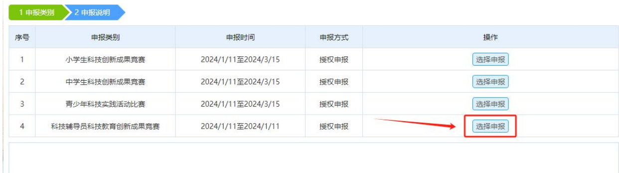
图 4 选择项目类型