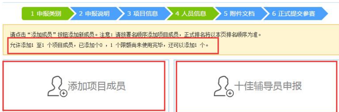
图 2-1 人员信息

第一步，在该页面的上部分有说明文字显示人员数量信息，在提交过程中请仔细查看，并且在该页面可以添加项目成员和十佳辅导员。