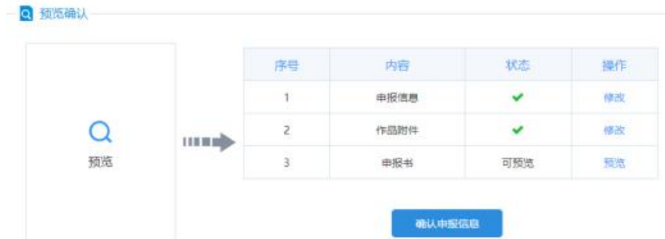
确认申报信息（确认前）