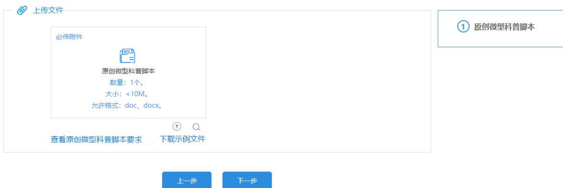
原创微型科普脚本-上传文件