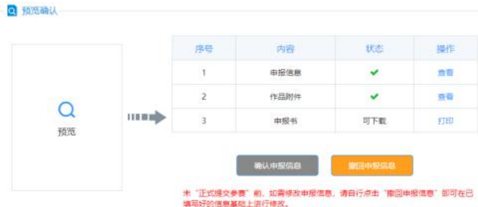
确认申报信息（确认后）